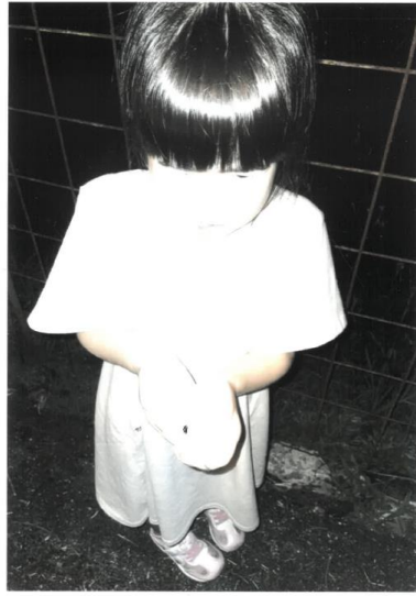
情報 2 3