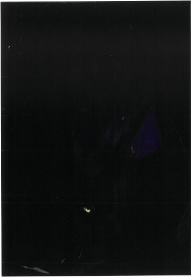
情報 1 9